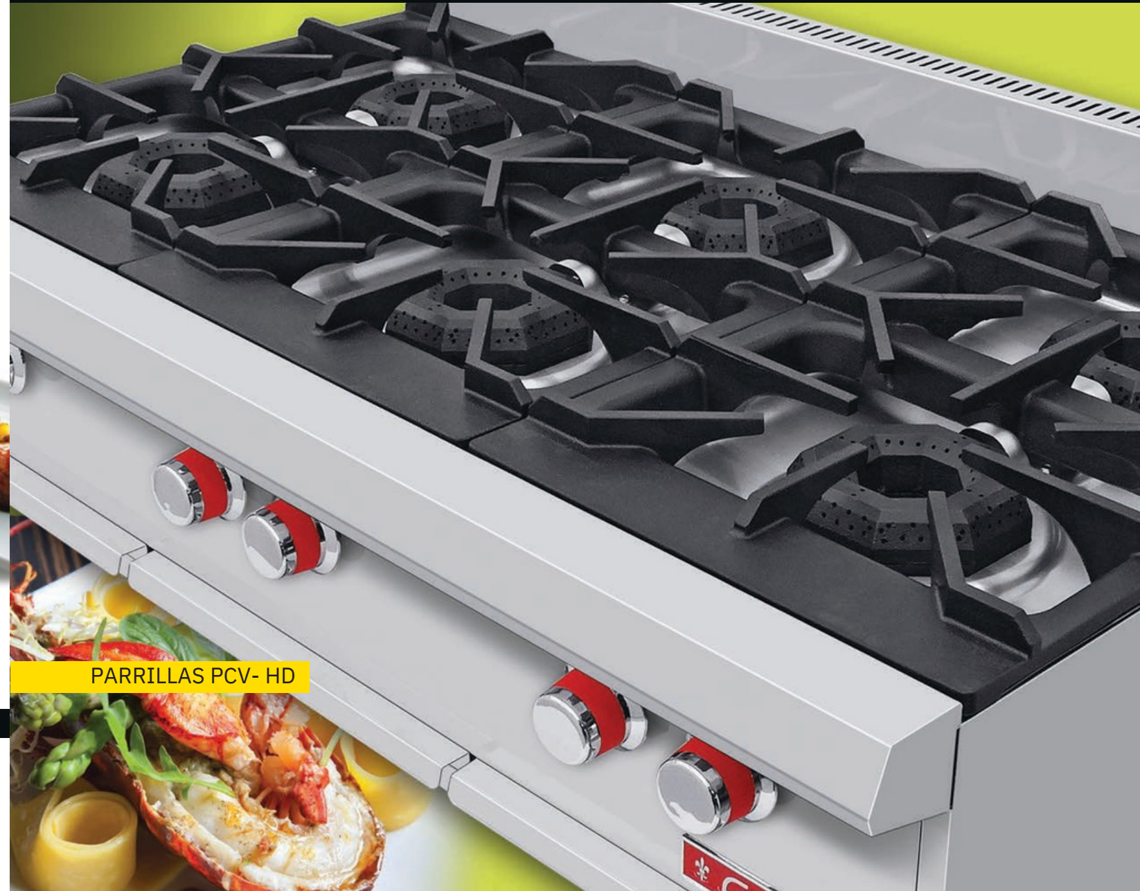
PARRILLAS PCV- HD