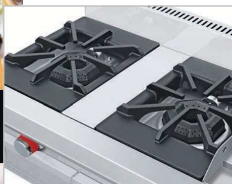
Robustas parrillas súper resistentes desmontables.