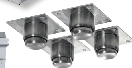
OPCIONAL: Base estructural o Kit de patas tubulares.