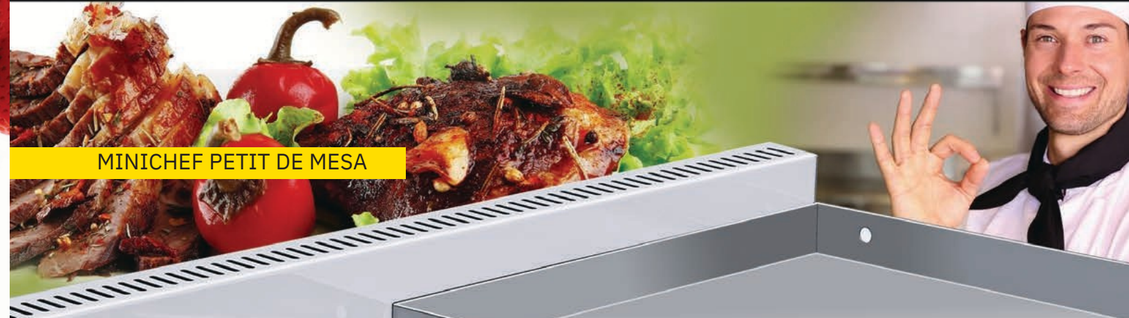
MINICHEF PETIT DE MESA