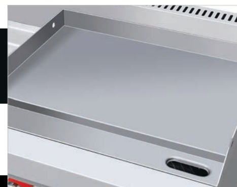
Plancha con exclusivo sistema recolector de grasa y residuos.