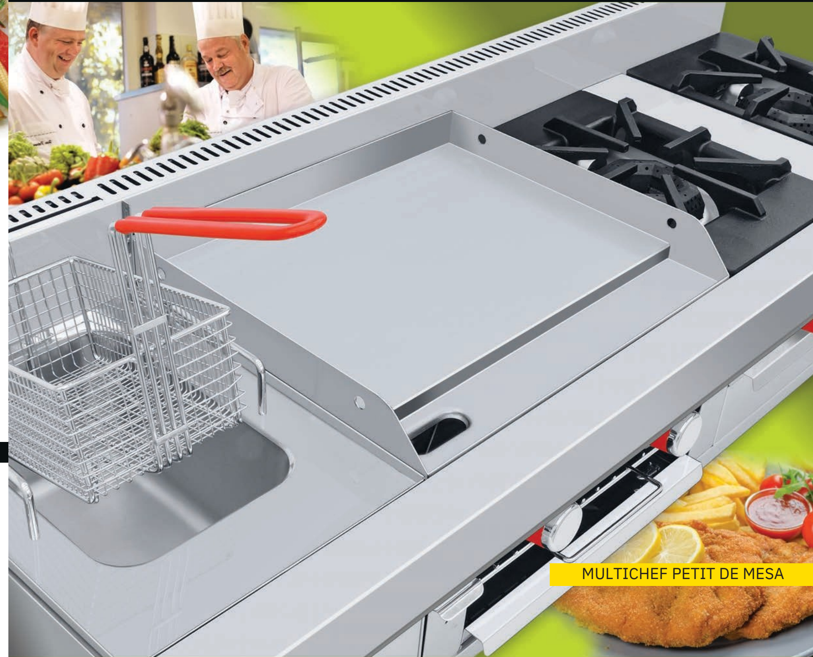
MULTICHEF PETIT DE MESA