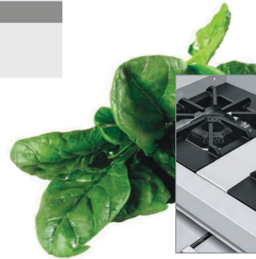
Robustas parrillas súper resistentes.