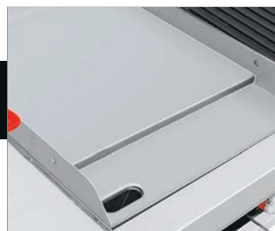
Plancha con exclusivo sistema para recolectar grasa y residuos.