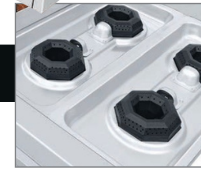
Cubierta semi-sellada para evitar derrames al interior.