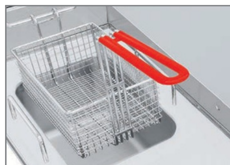
Prepare gran variedad de alimentos crujientes y doraditos al momento.