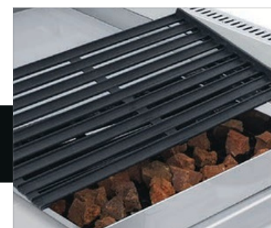
La piedra refractaria le garantiza calor constante y uniforme, además es reutilizable.