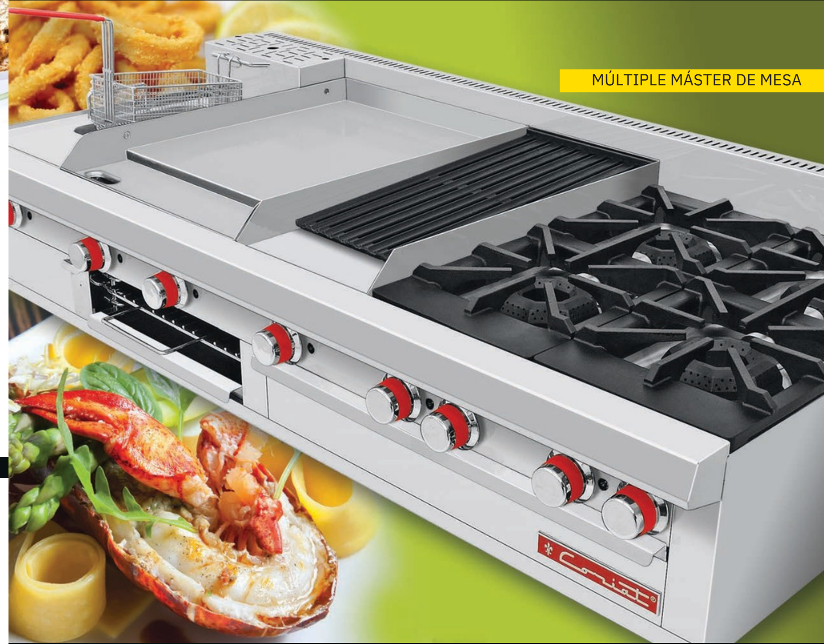
MÚLTIPLE MÁSTER DE MESA