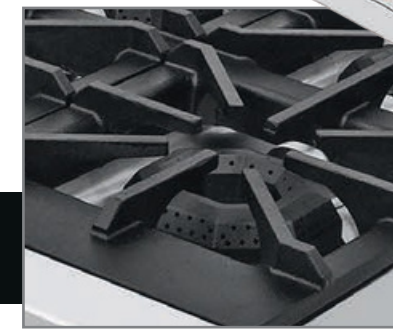
Robustas parrillas súper resistentes desmontables, facilitan la limpieza.