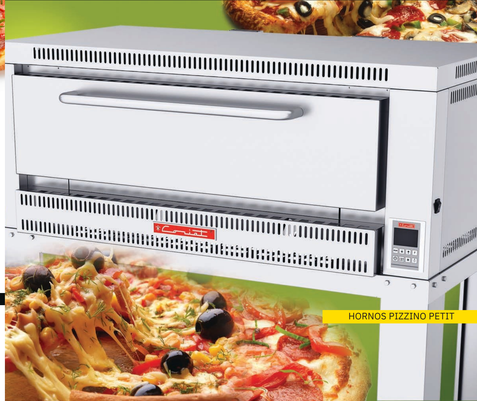
HORNOS PIZZINO PETIT